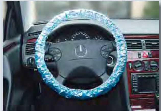
Langzeit-Lenkradschutz (Art.-Nr. D-L 20) mit Gummizug, passend für PKW-Lenkräder, aus extra-starkem Polyäthylen, Farbe: blau, 20-Stück-Karton