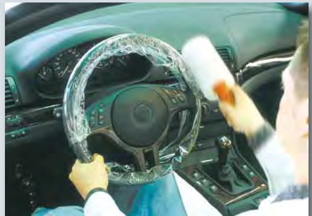
Einweg-Lenkrad- und Schalthebelschutz (Art.-Nr. D-L 42) passend für PKW- und LKW-Lenkräder, aus haftfähigem Polyäthylen, Haftfolie mit Griff für ca. 250 Anwendungen