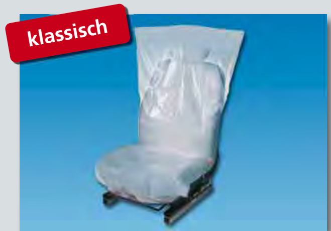
Sitzpolsterschutz „Classic“ (Art.-Nr. D-E 35) aus Polyäthylen, Farbe: weiß, Größe: 790 x 1300 mm, 500-Stück-Kompaktrolle