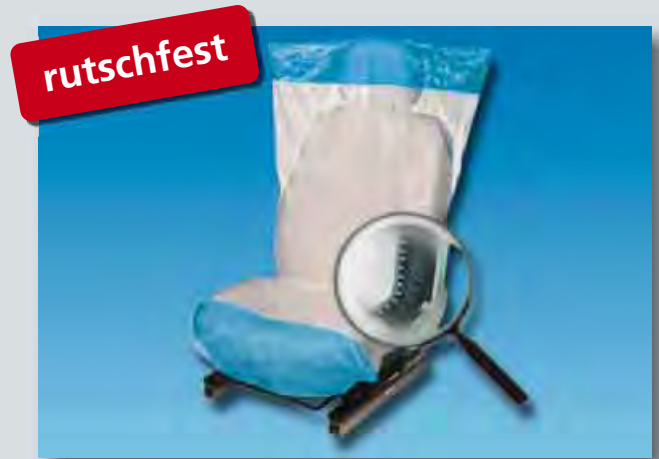
Sitzpolsterschutz „Optifit“ (Art.-Nr. D-E 2000) Unterseite rutschfest, aus Polyäthylen, Farbe: weiß/blau, Größe: 790 x 1330 mm, 500-Stück-Kompaktrolle