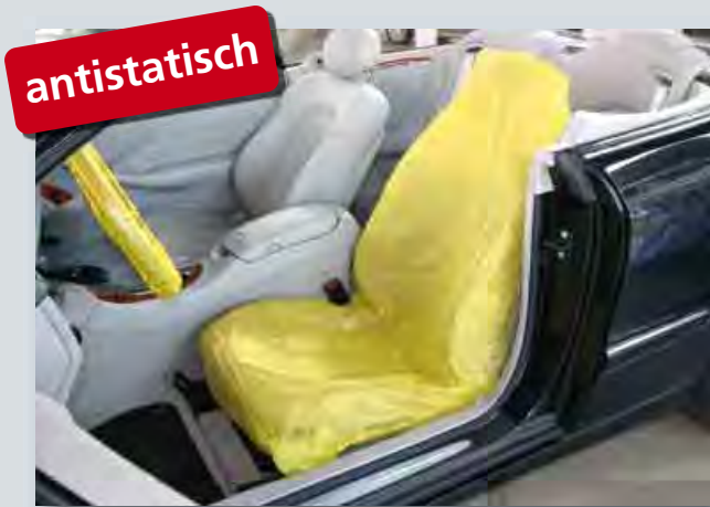
Sitzpolsterschutz „antistatisch“ (Art.-Nr. D-E 3000) zum Schutz elektronischer Geräte vor elektrostatischer Entladung, passend für alle Einzelsitze, aus extra-starkem, antistatisch ausgerüstetem Polyäthylen, Signalfarbe "Gelb", Größe: 840 x 1400 mm, 250-Stück-Kompaktrolle