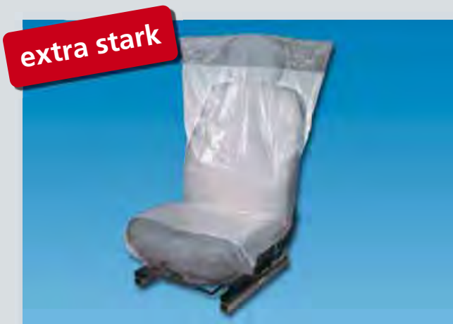
Sitzpolsterschutz „Optifit deluxe“ (Art.-Nr. D-E 2300) extra stark, Unterseite rutschfest, aus extra-starkem Polyäthylen, Farbe: weiß/silber, Größe: 790 x 1330 mm, 300-Stück-Kompaktrolle