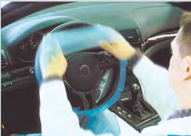
Einweg-Lenkradschutz (Art.-Nr. D-L 18) passend für PKW- und LKW-Lenkräder, aus stark dehnbarem Polyäthylen, 500-Stück-Kompaktrolle