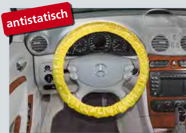
Langzeit-Lenkradschutz „antistatisch“ (Art.-Nr. D-L 3100) zum Schutz elektronischer Geräte vor elektrostatischer Entladung, mit Gummizug, passend für PKW- und LKW-Lenkräder, aus extra-starkem, antistatisch ausgerüstetem Polyäthylen, Signalfarbe: "Gelb", 20-Stück-Karton